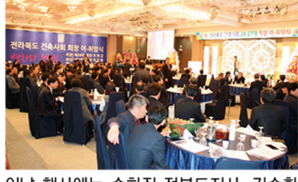
이날 행사에는 송하진 전북도지사, 김승환 전북도교육감 등 많은 내·외빈이 참석했다.