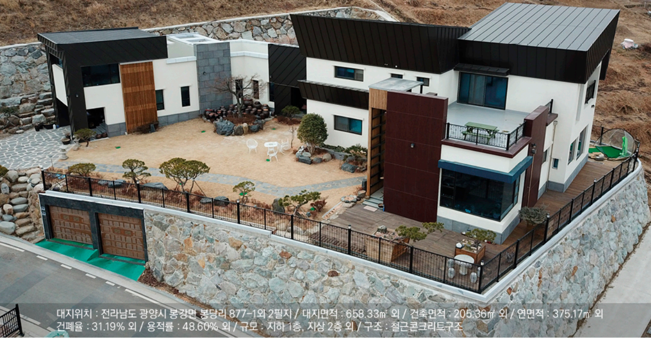
대지위치 : 전라남도 광양시 봉강면 봉당리 877-1와 2필지 / 대지면적 : 658.33㎡ 외 / 건축면적 : 205.36㎡ 외 / 연면적 : 375.17㎡ 외 건폐율 : 31.19% 외 / 용적률 : 48.60% 외 / 규모 : 지하 1층, 지상 2층 외 / 구조 : 철근콘크리트구조

김한얼 건축사 / (주)한얼 종합건축사사무소 전남 광양시 광양읍 서평10길 18-1, 2층 Tel. 061-763-8701