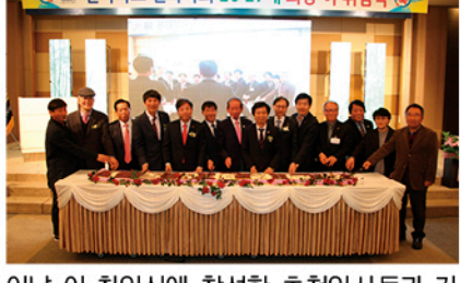
이날 이·취임식에 참석한 초청인사들과 기념 케이크 컷팅식이 진행됐다.