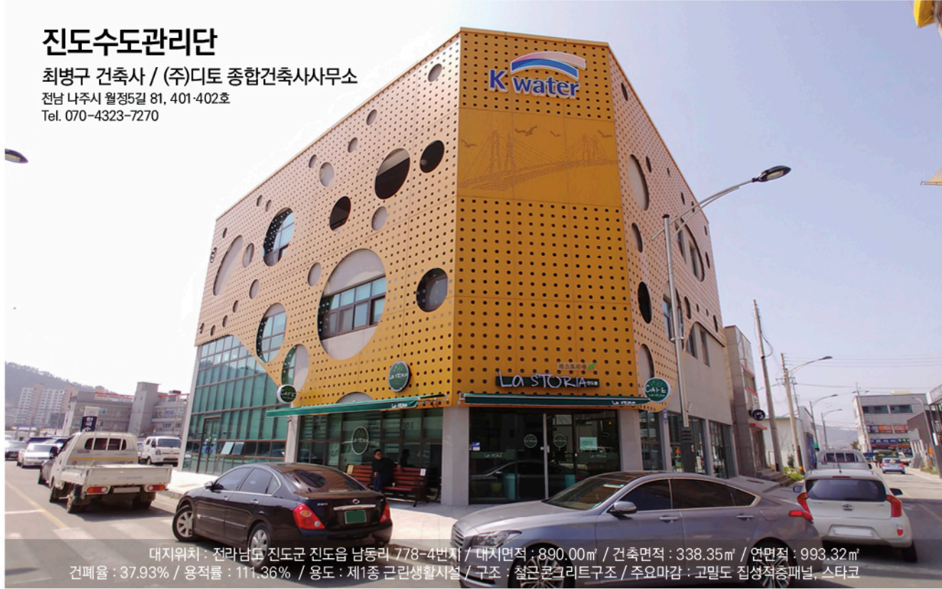
대지위치 : 전라남도 진도군 진도읍 남동리 778-4번지 / 대지면적 : 890.00㎡ / 건축면적 : 338.35㎡ / 연면적 : 993.32㎡ 건폐율 : 37.93% / 용적률 : 111.36% / 용도 : 제1종 근린생활시설 / 구조 : 철근콘크리트구조 / 주요 마감 : 고밀도 집성적층패널, 스타코

최병구 건축사 / (주)디토 종합건축사사무소 전남 나주시 월정5길 81, 401-402호 Tel. 070-4323-7270