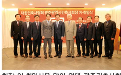
회장 이·취임식을 맞아 역대 광주건축사회장들과 기념촬영이 진행됐다.