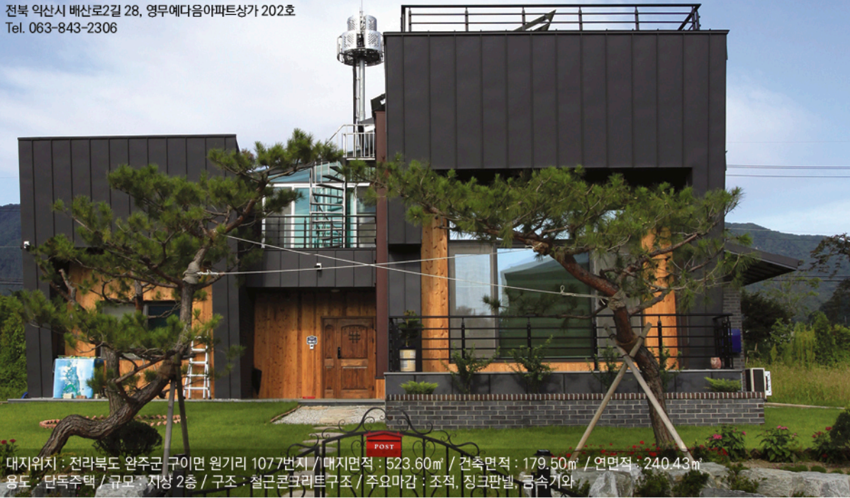
대지위치 : 전라북도 완주군 구이면 원기리 1077번지 / 대지면적 : 523.60㎡ / 건축면적 : 179.50㎡ / 연면적 : 240.43㎡ 용도 : 단독주택 / 규모 : 지상 2층 / 구조 : 철근콘크리트구조 / 주요 마감 : 조적, 징크판넬, 금속기와

박창균 건축사 / 예다음 건축사사무소 전북 익산시 배산로2길 28, 영무예다음아파트상가 202호 Tel. 063-843-2306