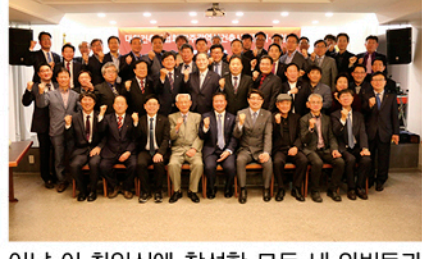
이날 이·취임식에 참석한 모든 내·외빈들과 합동기념촬영도 진행됐다.